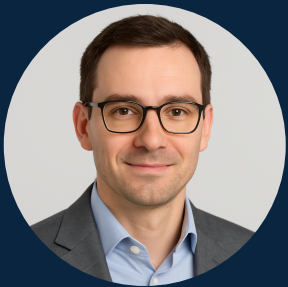
Leiter Personenschaden einer Schweizer Versicherung

...die den Fachexperten befähigt schnell zu handeln.